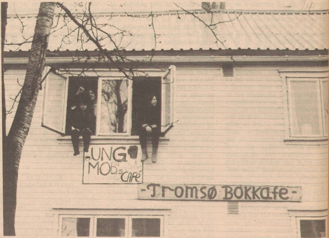
— Det vi trenger, er et hus!