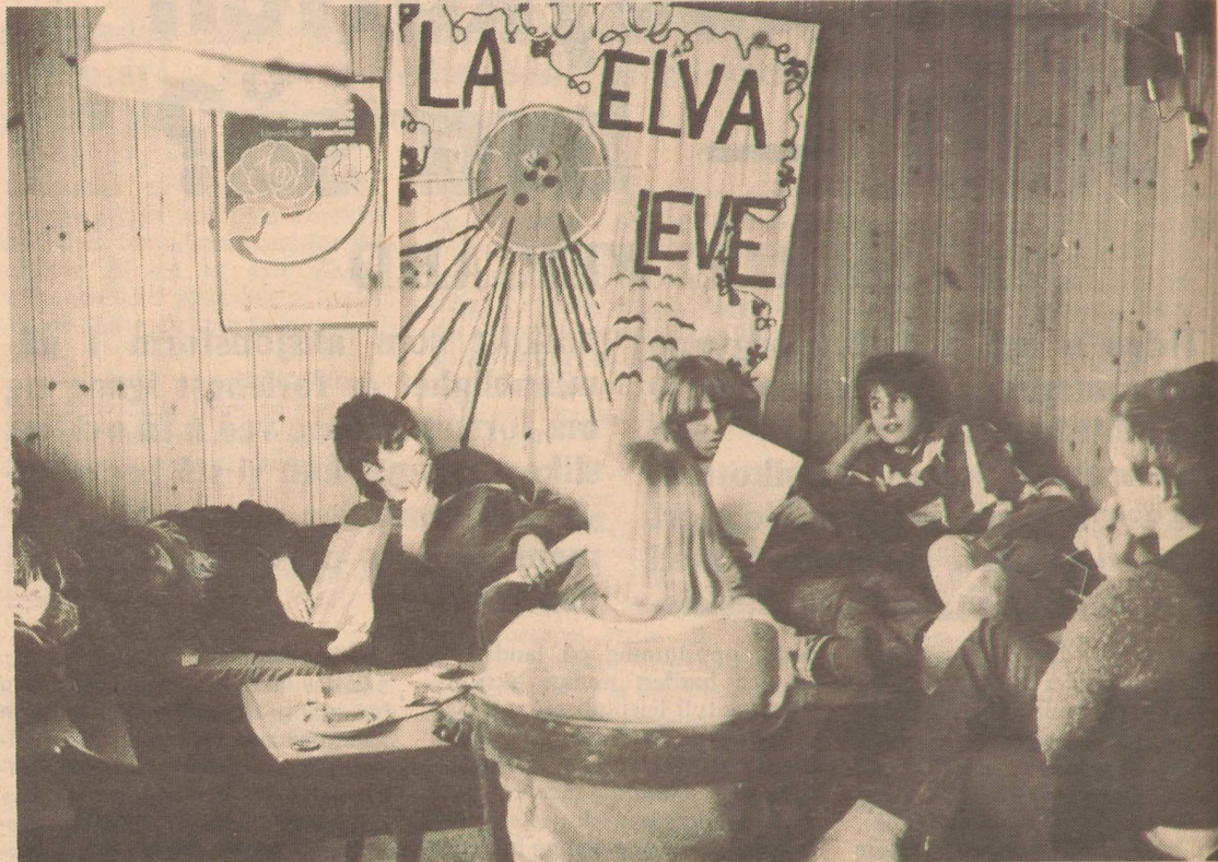
— Si til Brox og dem at vi har hatt nok møter! Det kommer ingen ting ut av dem.

— Når folk får holde på med det de har lyst til, blir det ikke nødvendig å dope seg ned. Folk ruser seg fordi de ikke har noe å gjøre, ikke få gjøre ting de har lyst til å drive med. Vi vil ha en alkoholfri kafé, uten spiseplikt eller noe slags kjøpeplikt. Rett og slett et sted å være! sier de, og det har de, og