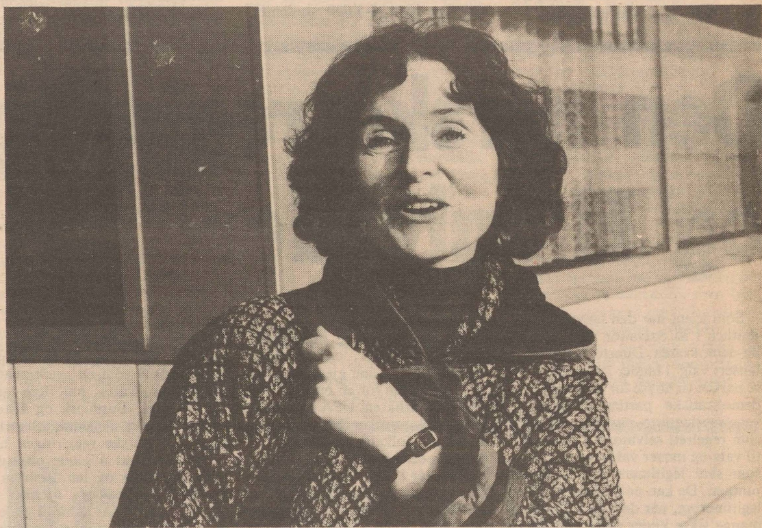
— Jeg kan ikke se at å studere litteratur skulle ødelegge spontaniteten som forfatter.

— Tora og hennes skjebne ga meg aldri fred, hun sto i veien for all forfattervirksomhet. Tilslutt bare måtte hun fram og det var en lettelse å få skrevet ned historien om henne. Jeg prøvde først å lage en novelle om henne, men det gikk ikke.