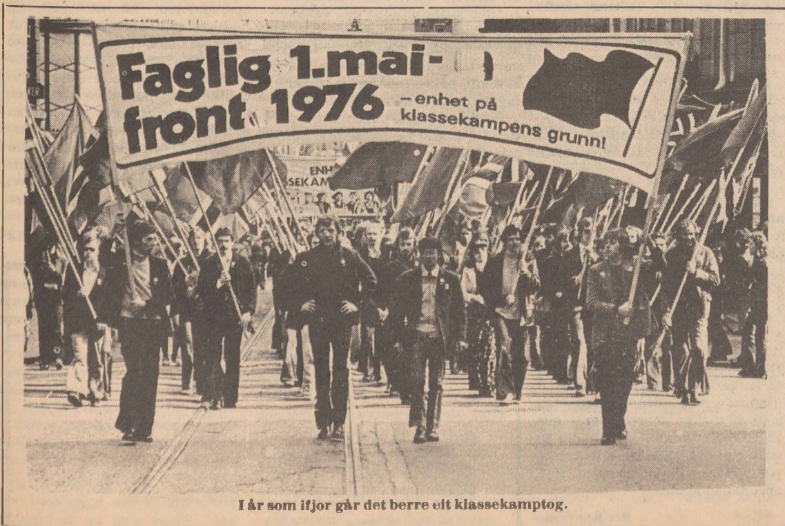
I år som ifjor går det berre eit klassekamptog.

Forby Norsk Front – steng nazistar ute frå lærestadene.