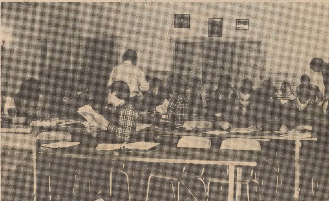
Fra landsmøtet i Forbundet Mot Rusgift som betydde en styrking av den rusgiftpolitiske kampen.