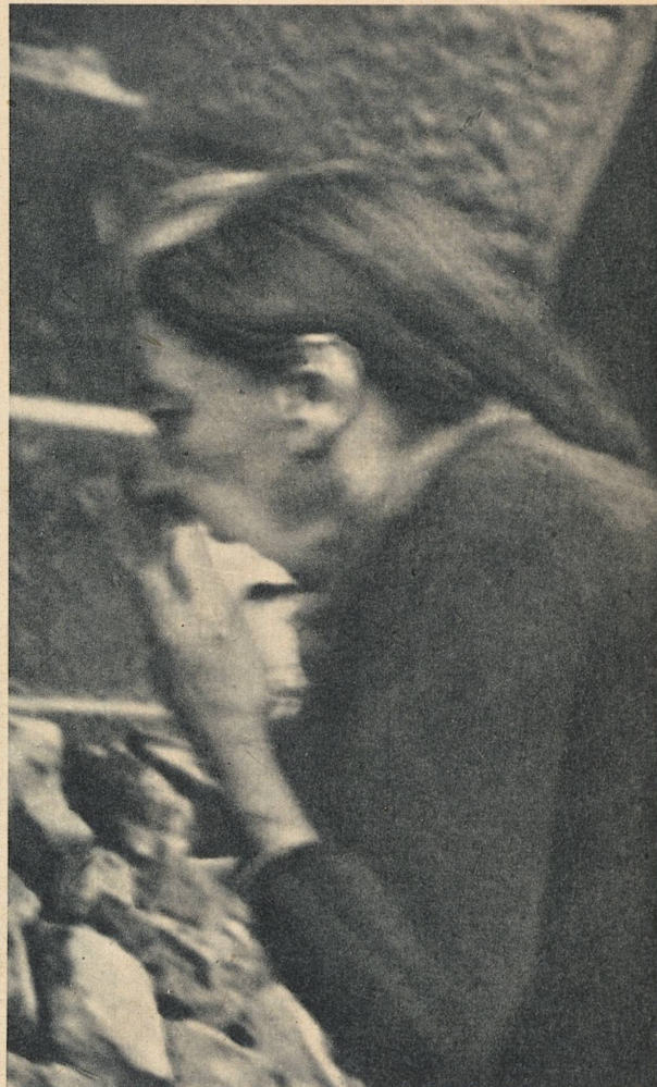
En mor i Romania