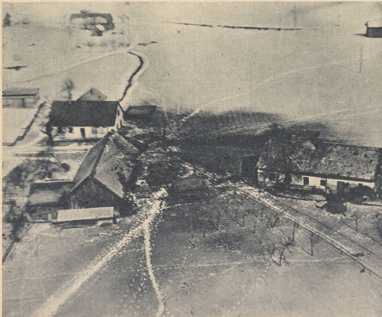
Et annet bilde blant mange: en bondegård i snøen — truffet av en velrettet bombe. Systematisk som med boligkvarterene forsøker englenderne også å treffe bøndene, deres kveg og avlinger: som i den første verdenskrigen skal sulten gjør Europa mør