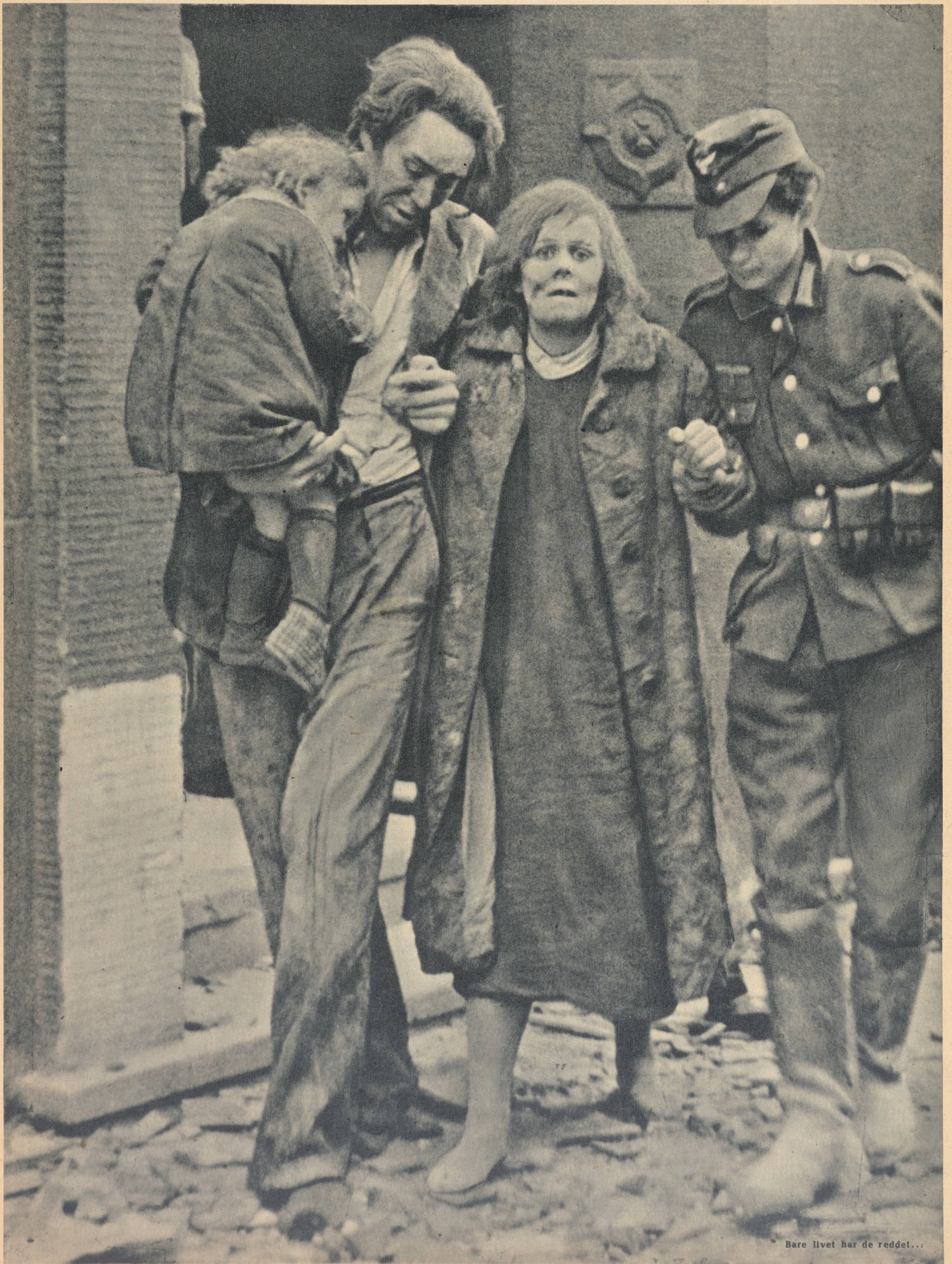
Bare livet har de reddet...