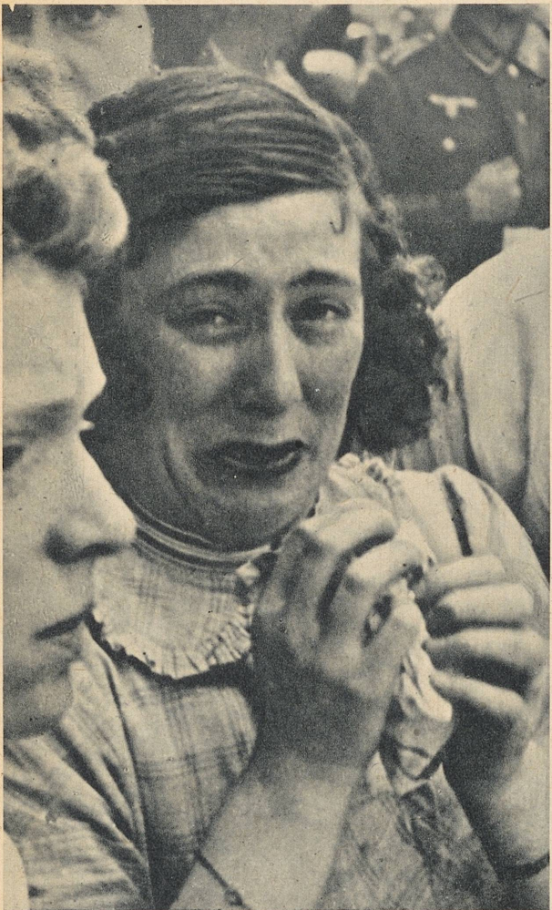
Overfor de døde barna: en mor i Frankrike