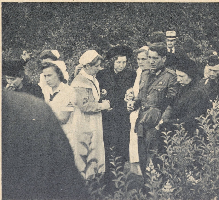
Krenket soldatånd: hans foreldre ble myrdet i heimen av engelske bomber, mens han sto ved fronten i ærlig kamp