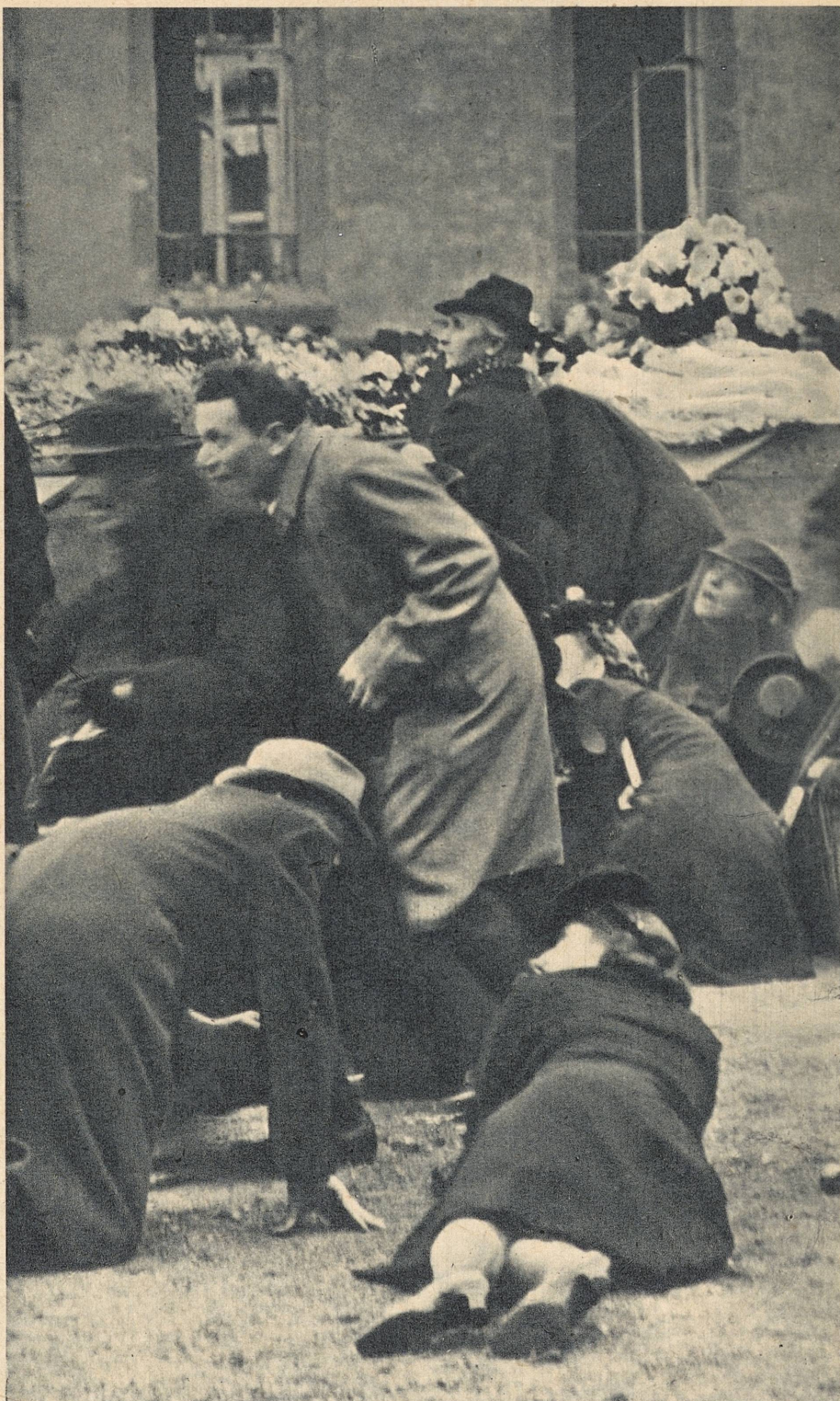
Maskingeværangrep fra engelske jegere mot et liktø for ofrene ved den engelske luftterror i Paris

Vi sier i dag med fullt alvor som den, der vet hva han taler om: heller ikke det som natten fra den 15. til den 16. juni begynte med bombing av Sør-England og London, var det siste tyske svaret.