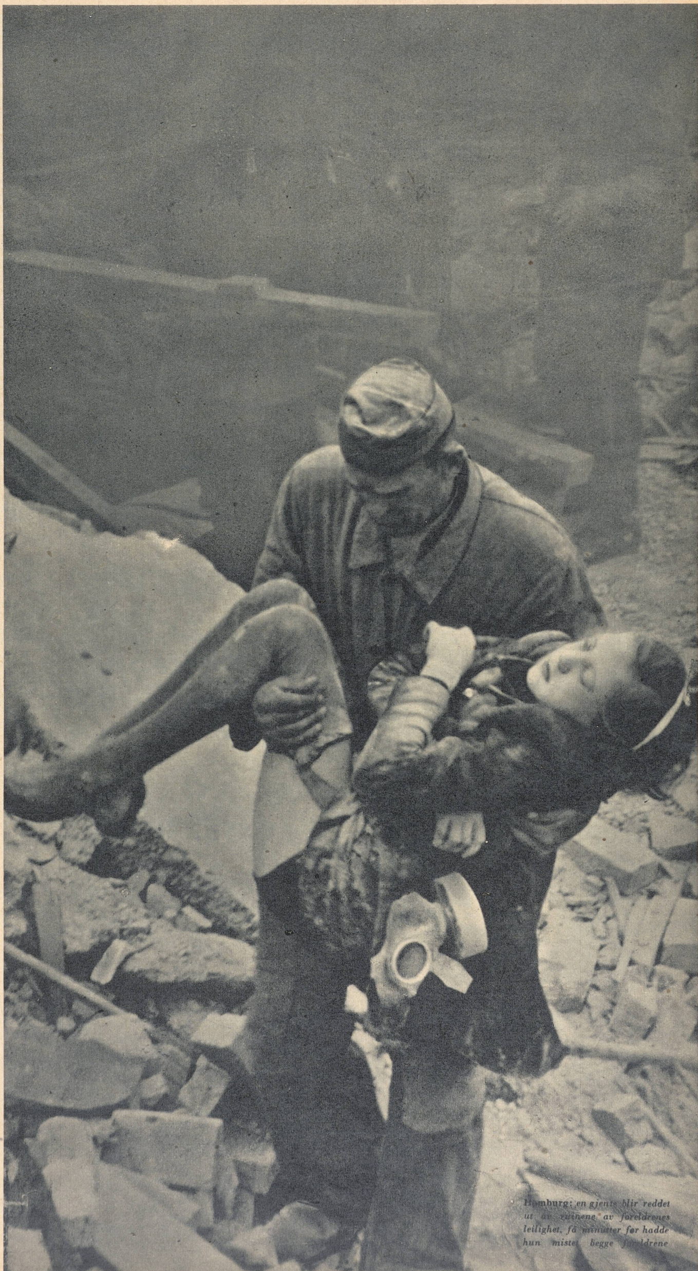
Hamburg: en jente blir reddet ut av ruinene av foreldrenes leilighet, få minutter før hadde hun mistet begge foreldrene

fordi Englands bomber gjør barna i Europa til krøplinger