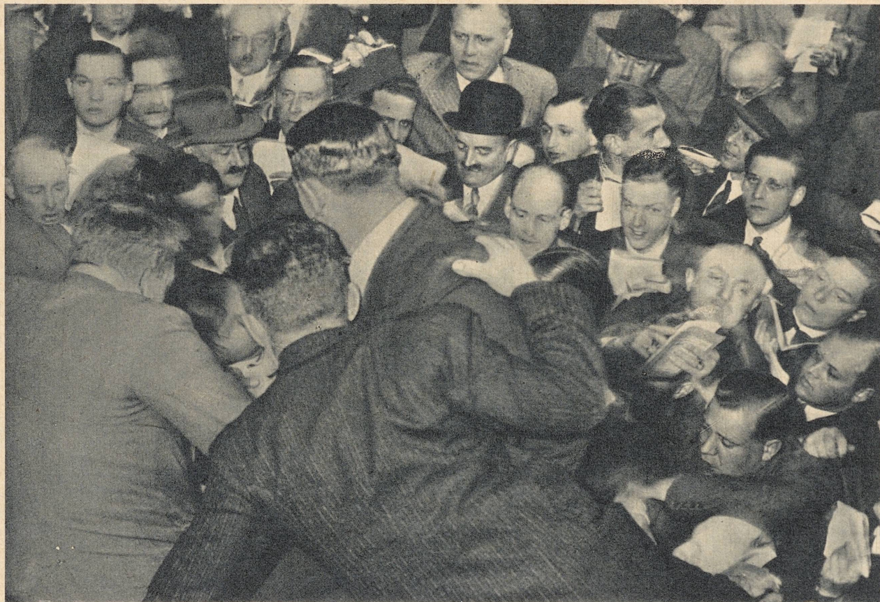
Det slaget, for hvilket Englands soldater faller: en storkampdag på børsen

Prinsipielt til begynnelsen av gjengjeldelsesslagene mot øya