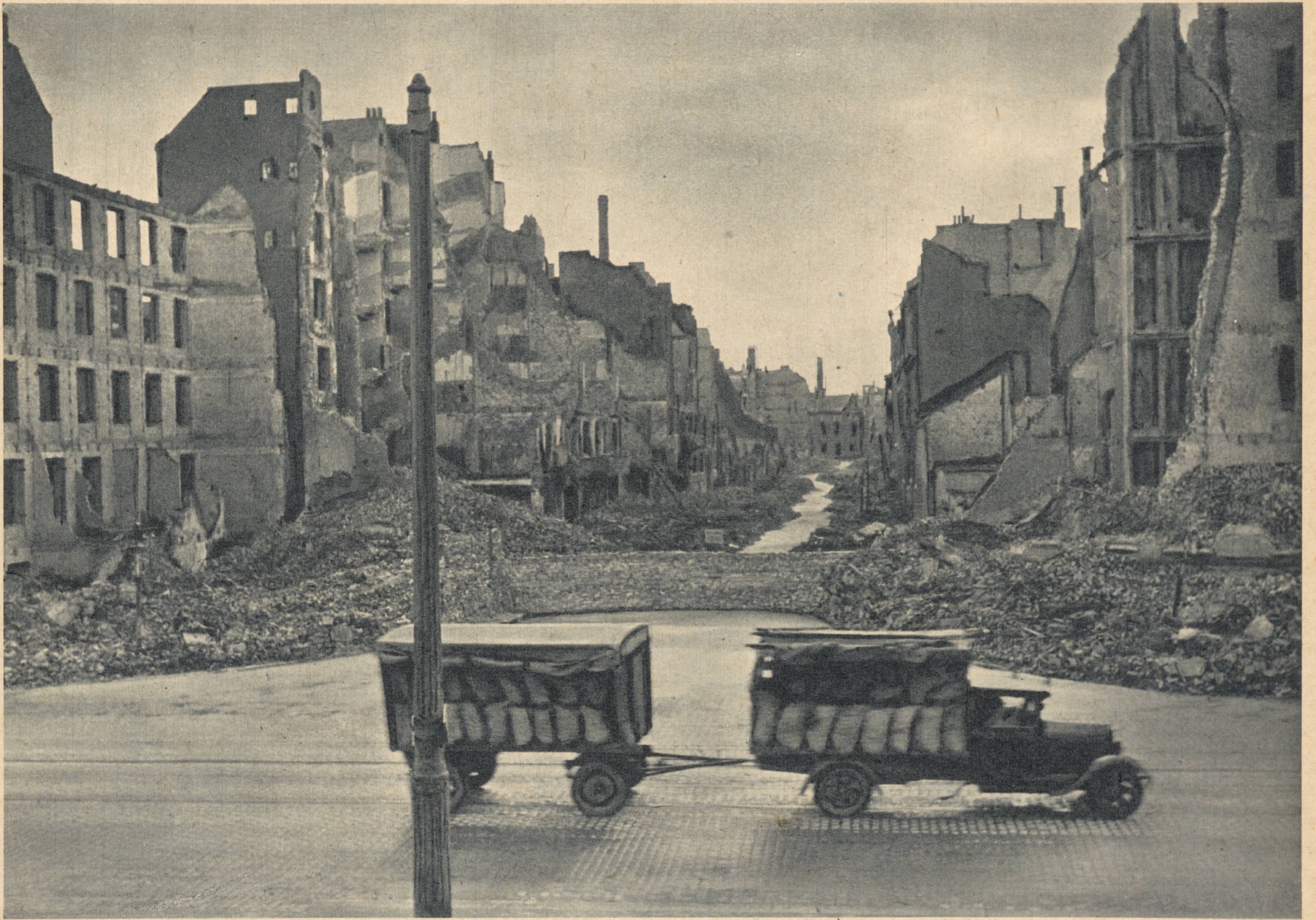
Et av mange bilder: en gate i et boligkvarter i en tysk by. For de døde under deres ruiner skyter Tyskland mot England